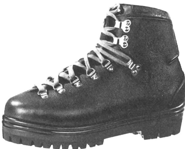
Everest Fr. 169.— Berg- + Kletter- schuh für höchste Ansprüche

Das Spezialgeschäft für Bergsteiger Hochtouristen und Skifahrer