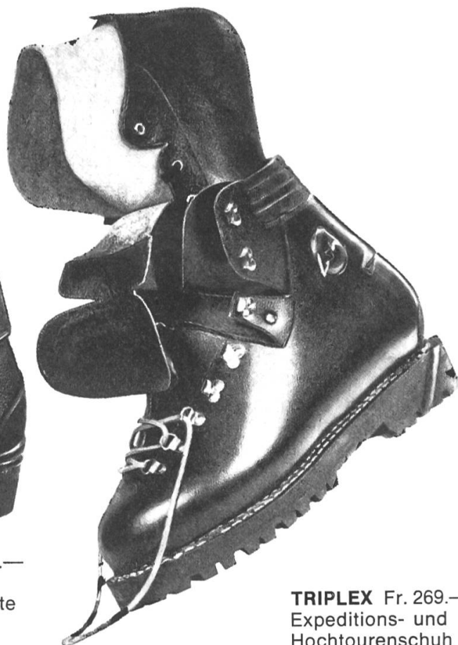
TRIPLEX Fr. 269.— Expeditions- und Hochtourenschuh