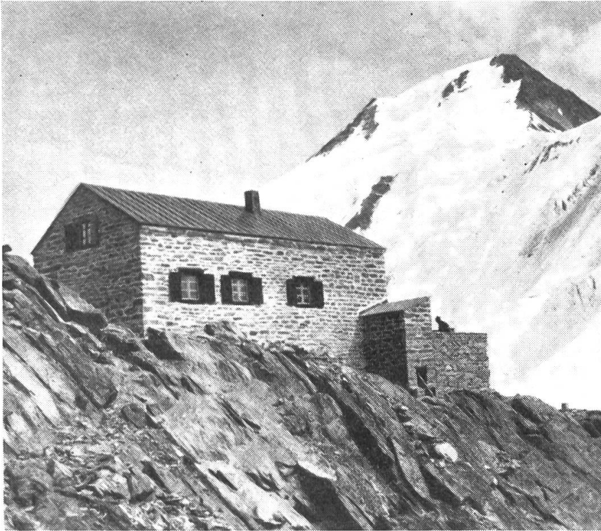
Lötschenhütte Hollandia 1933

beim Bau der Wildstrubelhütte bewährt hatte. Bereits im Herbst 1932 wurden die Vorarbeiten soweit vorangetrieben, dass am 31. Mai 1933 mit dem Transport des Materials ab Jungfrau-joch begonnen werden konnte. Am Kranzberg wurde als «Zwischenstation» eine Baracke erstellt, die zum Schlafen und Kochen für die Belegschaft eingerichtet wurde. In Anbetracht der heute als selbstverständlich geltenden Transportmöglichkeiten mittels Flugzeug und Helikopter kann man sich die Art der Transporte in den Baujahren der Egon-von-Steiger-Hütte und der Hollandia-Hütte kaum mehr vorstellen. Wir klagen über einen schweren Rucksack, den wir vom Jungfrau-joch teils abfahrend, teils aufsteigend in die Lötschenhütte hinaufschleppen. Noch mehr seufzen wir, wenn wir gar den Aufstieg von Blatten aus wählen. Welche unsägliche Mühe und Zähigkeit bedurfte es aber, um das Material zum Bau einer neuen Hütte über die gleichen Strecken in die Lücke hinauf zu schleppen? Für die Hollandia-hütte wurden z. B. folgende Gewichte errechnet: