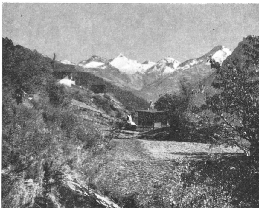
Bei Finnen ob Eggerberg