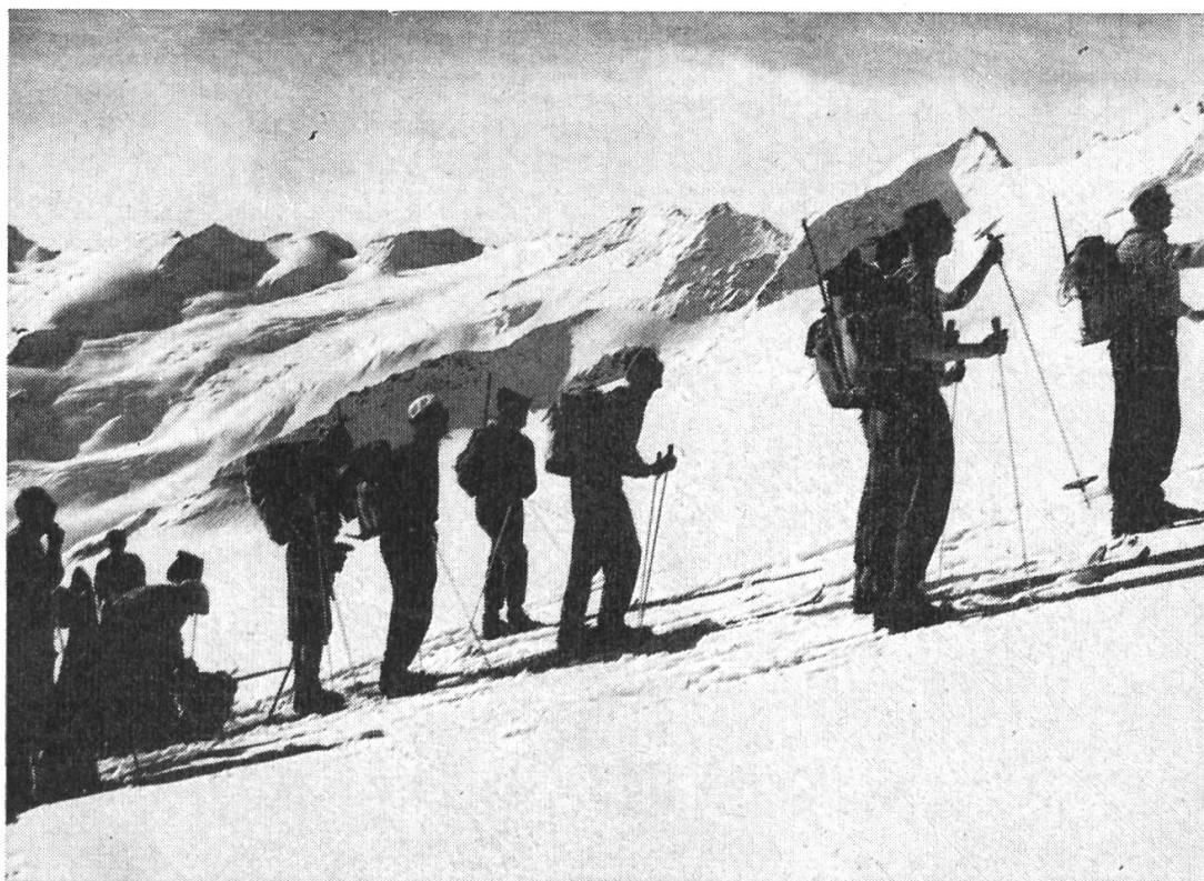
Im Aufstieg unterhalb der Wetterlimmi, vor der Kette des Ewigschneehorns.