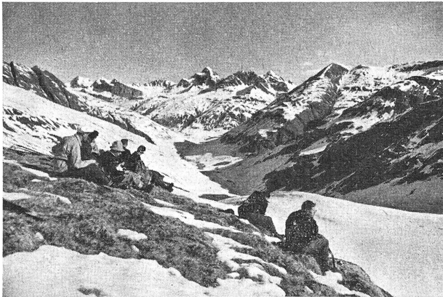
Im Aufstieg zum Gletscherhorn. Im Hintergrund Piz Platta

Mit kaltem und nebligem Wetter wartete der Donnerstagmorgen auf. Dennoch verliessen wir um 05.30 Uhr Cresta und wandten uns dem Piz Piot (3053 m) zu.