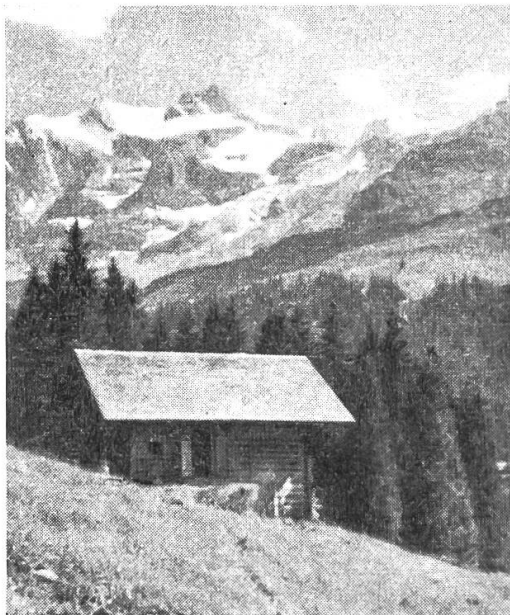
Die Bütt hütte, mit Blick gegen Hohtürli