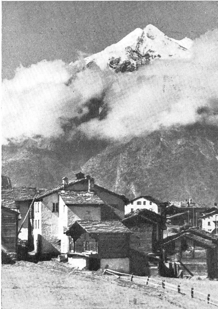
Grächen mit Weisshorn