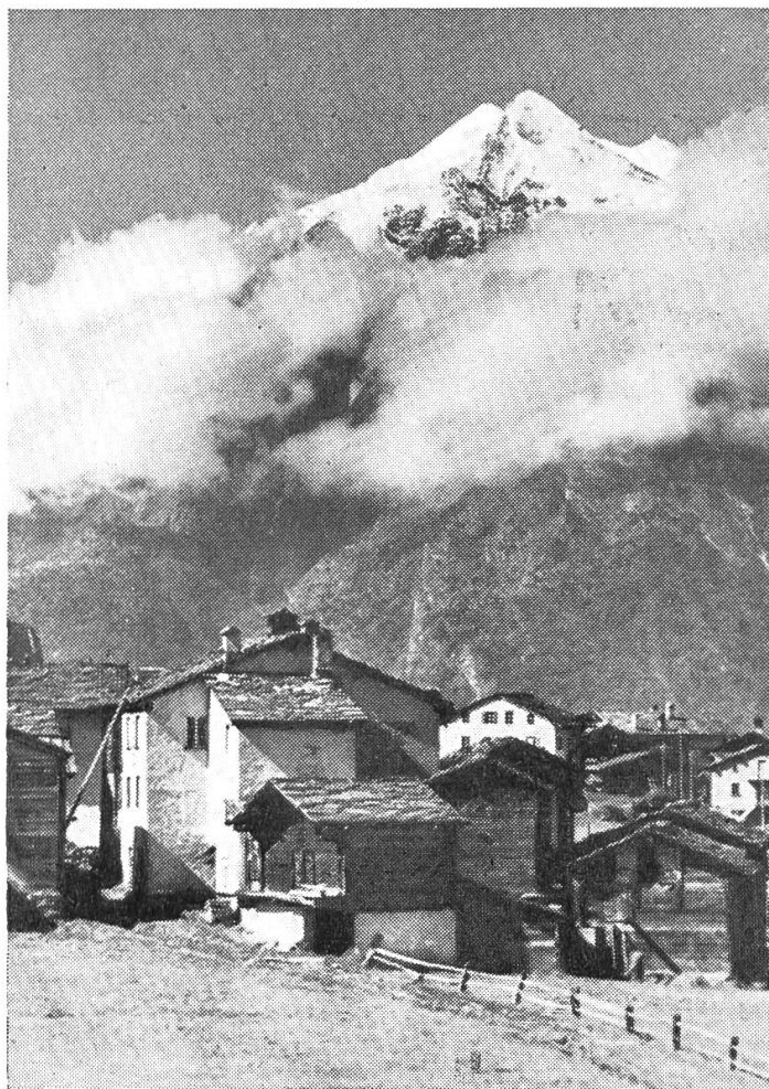
Grächen mit Weisshorn