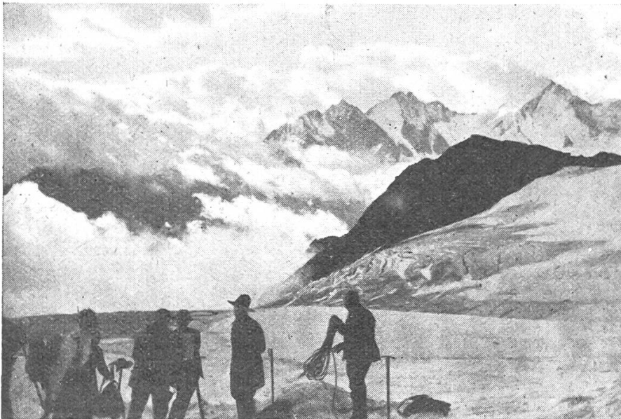
Frühmorgens auf dem Abberggletscher. Hintergrund: Nadelgrat und Dom.

Ihrer 9 hatten sich gemeldet. 4 waren schon im Vispertal in den Ferien, 2 Herren aus Strassburg, wovon einer Mitglied des französischen Alpenclub, der andere Mitglied der Sektion Bern, weilten in Kandersteg und die übrigen 3 gingen in Bern dem Alltag nach. Als es am Freitag zur endgültigen Verabredung ging, fuhr Blitz und Donner dazwischen, so, dass es nicht möglich war, die vier im Vispertal durch den Draht zu erreichen. Auch mit Kandersteg kostete es Mühe. Da der Wettergott nur zeitweilig verstimmt schien, machten sich die 3 Berner am Samstag morgen auf den Weg, d. h. die Bahn. In Kandersteg schlossen sich die beiden Strassburger an. In St. Niklaus erwarteten uns der Führer Alex.