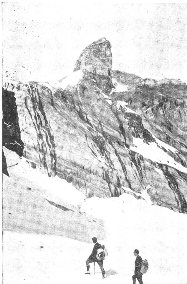
Gross-Fisistock vom Biberg-Gletscher.

Wir stiegen zunächst in südlicher Richtung das schwach geneigte Firnfeld bis zu der Wand empor, über die hinauf wir zum Pass gelangen wollten. Die Angaben im Berner Hochgebirgsführer sind kurz und geben für die mehr links (im Sinne des Anstiegs) gegen das Klein-Doldenhorn zu liegenden Partien Steinschlaggefahr an, für die rechten bloss eine Möglichkeit des Aufstieges. Der Augenschein (besonders der spätere von oben!) zeigte bald, dass diese « Möglichkeit » für uns nicht in Betracht kam. So versuchten wir es denn links, wo wir tatsächlich ohne grosse Schwierigkeiten, bald rechts, bald links etwas traversierend, nach etwa einer Stunde die Höhe des Grates ungefähr 50 m östlich der tief-