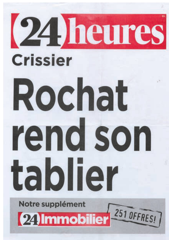
Manchette du 24 heures, le 29 juin 2011.

www.nathanaelrochat.ch . www.mirkorochat.com . www.annerochat.com . www.mayarochat.com . www.sosofluo.com . www.lyneste.de . www.nadegerochat.com . www.mx3.ch/deaddogcafe . www.isabelrochat.ch . www.lesleyrochat.com .