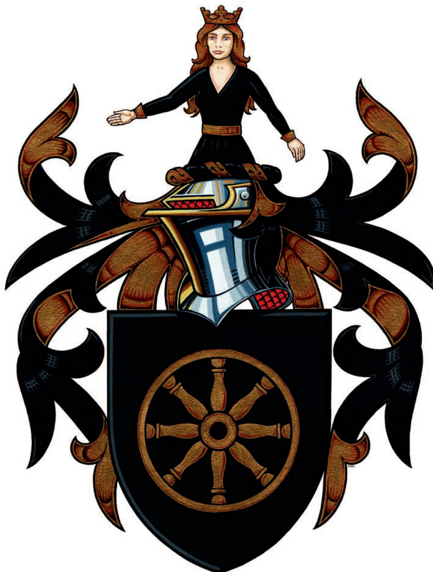
Armoiries complètes de la famille Rochat, toutes branches réunies, réalisées par Marie Lynskey, 2005.