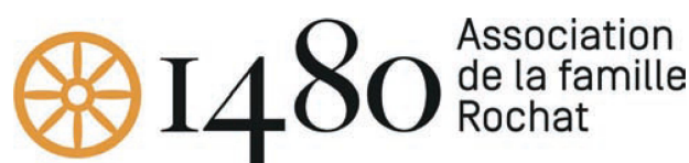
Logo de l'Association, réalisation WGR Lausanne, 2019.