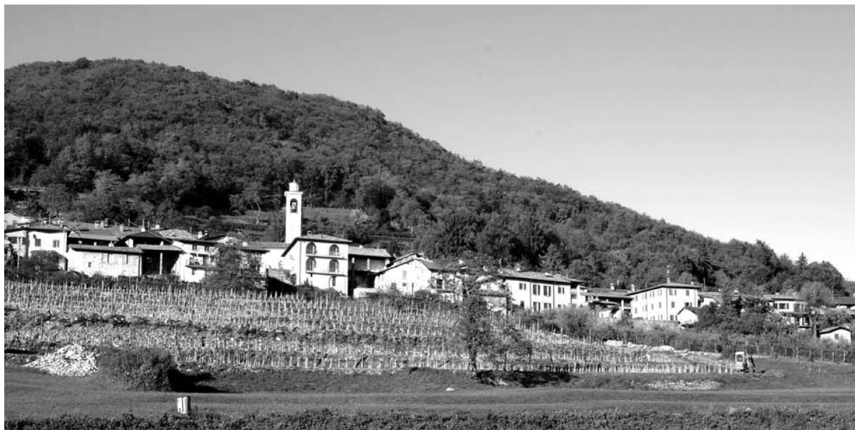
Le village de Meride TI.

Source : Photographie Tatiana Di Dio, octobre 2013.