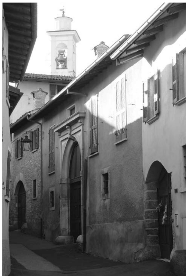
Une ruelle du village de Meride TI.

Source : Photographie Tatiana Di Dio, octobre 2013.