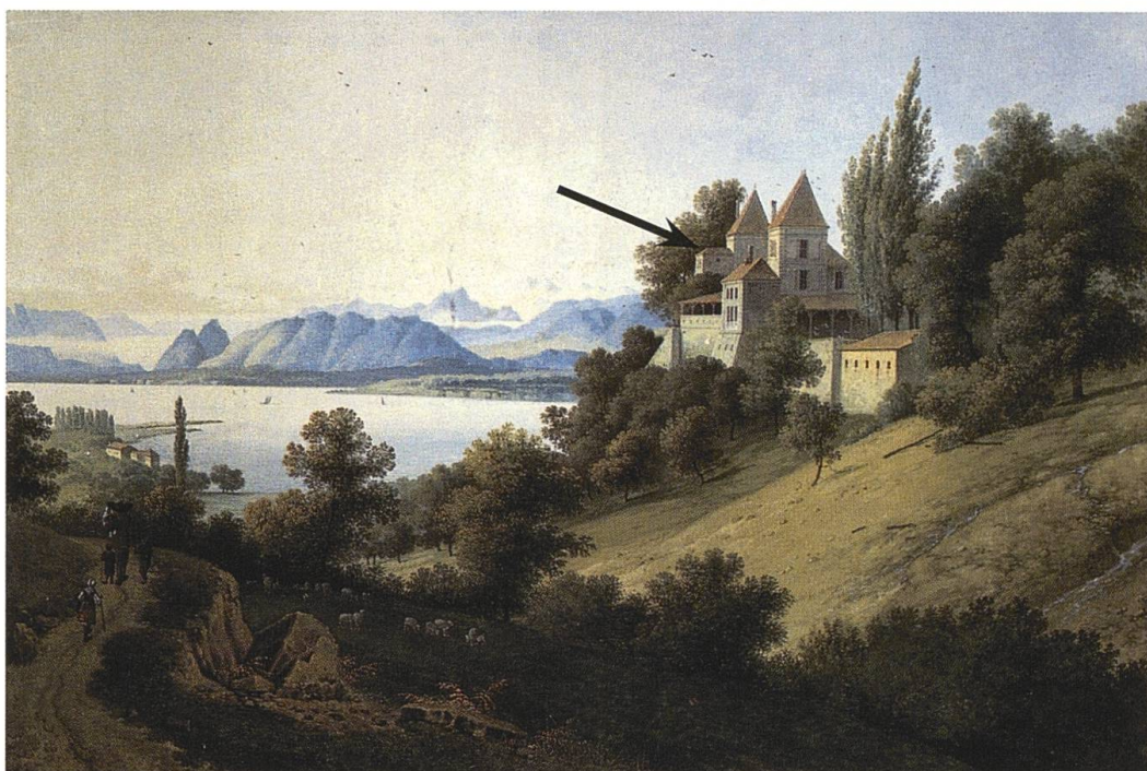
PRANGINS, château (tourelle sanitaire), façade nord-ouest , Louis Cugnet I, charp. (1784). © SCHOULEPNIKOFF, Chantal de, Le château de Prangins : la demeure historique , Zurich : Musée national suisse, 1991, couverture (gouache vers 1820, 53,5 x 78 cm).