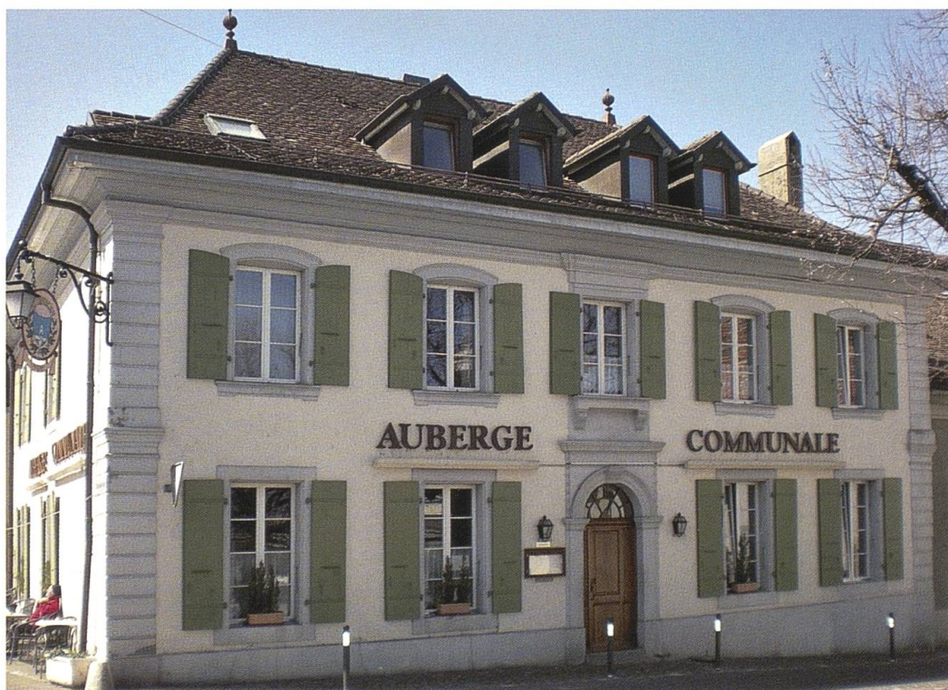
PRANGINS, maison de commune, Louis Cugnet II, charp. (1797). © Photographie Loïc Rochat, 14 avril 2010.