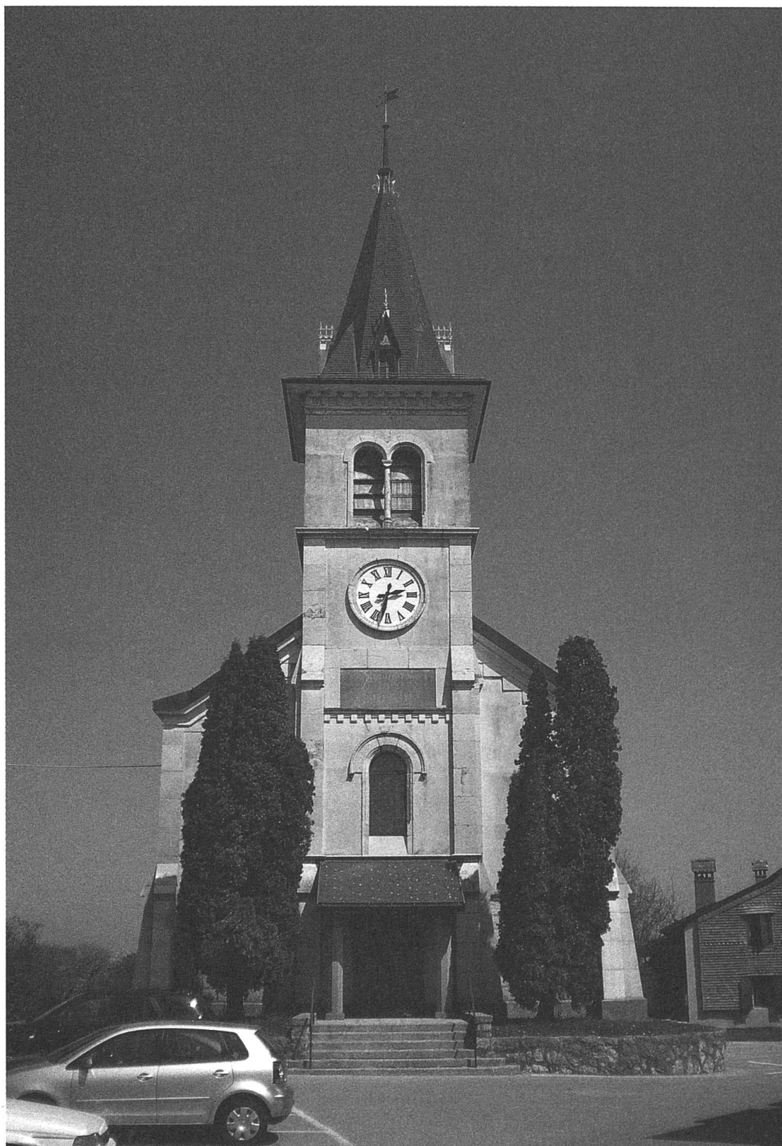
SAINT-OYENS, temple paroissial, Louis Cugnet IV, archit. (1877). © Photographie Loïc Rochat, 24 avril 2010.