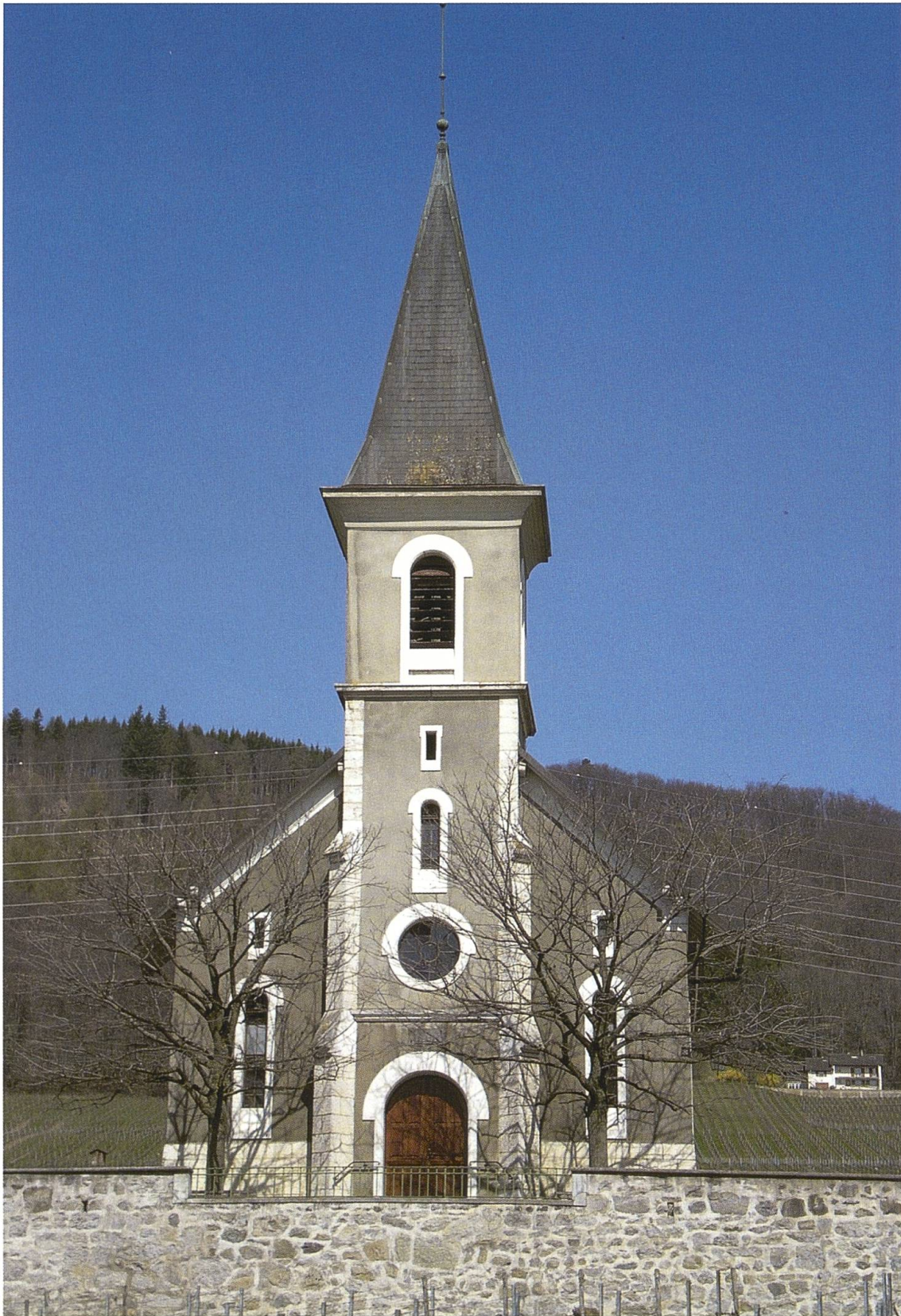
GILLY, temple paroissial, Louis Cugnet IV, archit. (1886). © Photographie Loïc Rochat, le 11 avril 2010.