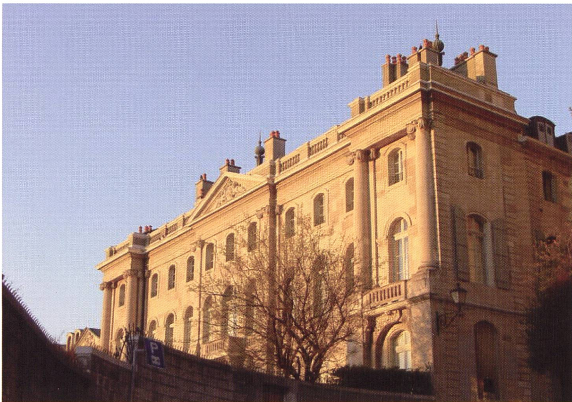
Hôtel de Saussure, rue de la Tertasse, Genève.