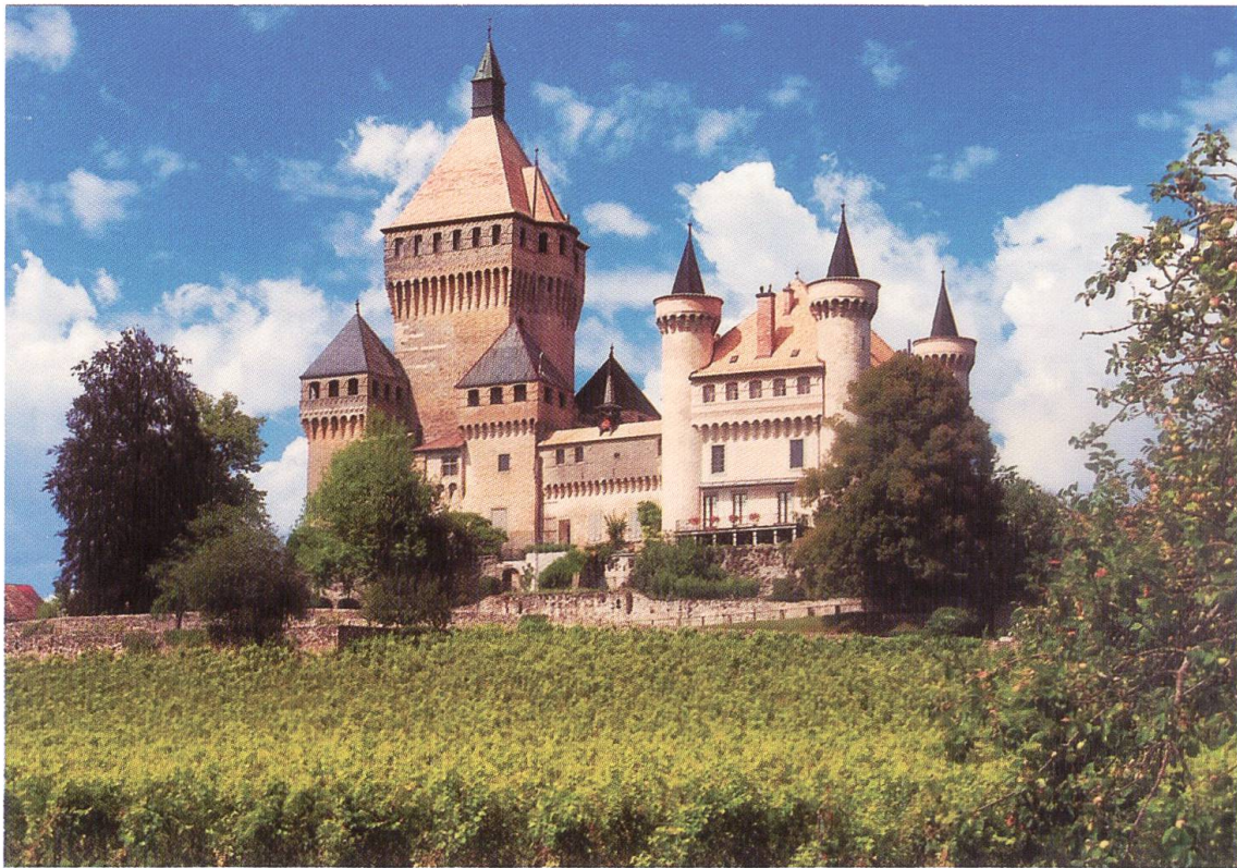
Le château de Vuflens