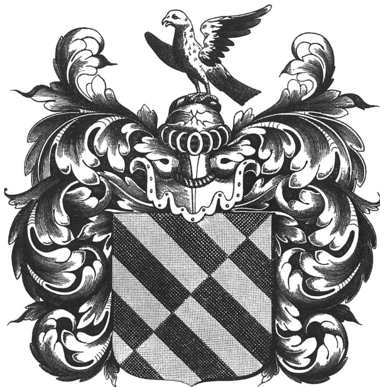
Les armoiries De Saussure.

BOURGEOISIES : Lausanne (1556), Genève (1635), Crissier (1643). Dailens (avant 1678).