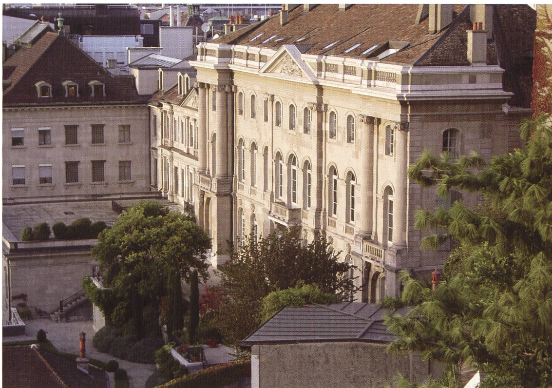
Hôtel de Saussure, rue de la Tertasse, Genève.