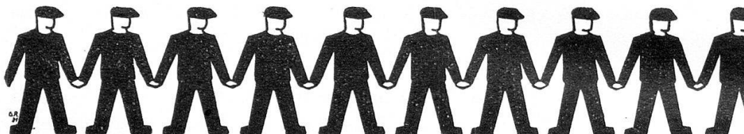
Union syndicale suisse (1 figure = 20,000 membres)

2 Tirés du rapport de la caisse d'assurance-chômage.