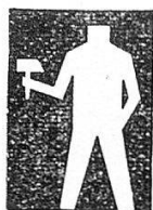
Fédérations confessionnelles et jaunes

Chacune des figures représente 20,000 ouvriers organisés. Les huit figures noires représentent les ouvriers, employés et fonctionnaires organisés dans l'Union syndicale suisse.