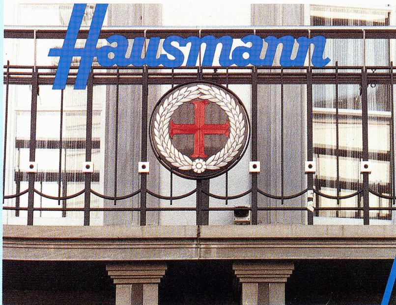
Das Signet des alten Heiliggeist-Spitals am Hause Marktgasse 11, das von 1228 bis 1845 zum Stadtspital gehörte.

Die Firmen sind in der Hausmann Holding AG zusammengefasst und werden massgeblich von der Familie des Gründers geleitet.