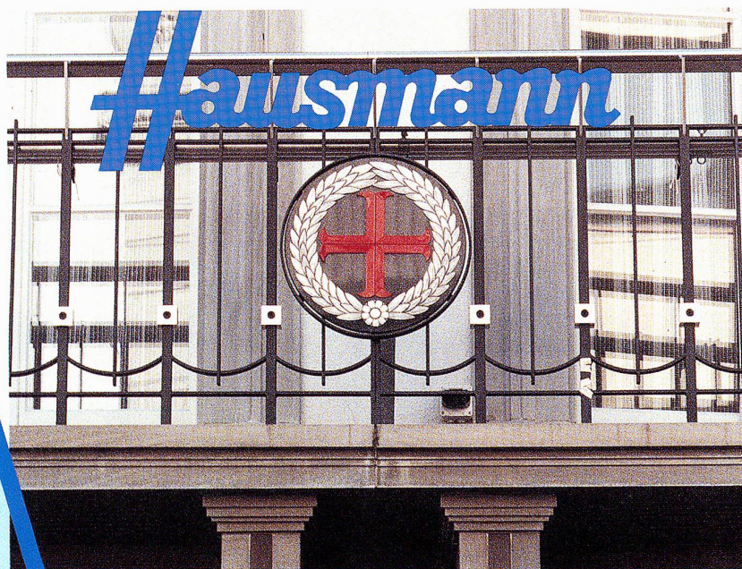
Das Signet des alten Heiliggeist-Spitals am HansH Marktgasse 11, das von 1229 bis 1845 zum Städtspital gehörte.