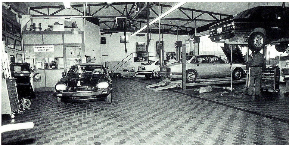
Nobelmarken wie Jaguar und BMW verlangen Sorgfalt und Fachwissen in der Werkstatt

Ein Grund mehr, der Emil Frey AG St. Gallen einen Besuch abzustatten – und sei es für eine Probefahrt!