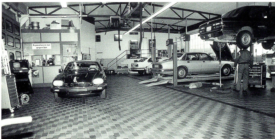
Nobelmarken wie Jaguar und BMW verlangen Sorgfalt und Fachwissen in der Werkstatt

Ein Grund mehr, der Emil Frey AG St. Gallen einen Besuch abzustatten – und sei es für eine Probefahrt!