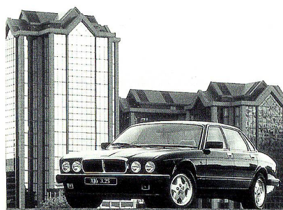
Jaguar bleibt Jaguar – ein Klasse für sich

Damit der Klimakomfort im Fahrgastraum gewährleistet ist, sollte man die Klimaanlage seines Wagens einmal jährlich, vorzugsweise im Frühling – das leuchtet ein! – kontrollieren lassen. «Evakuieren» nennt der Fachmann das. Eventuelle Schäden wer-