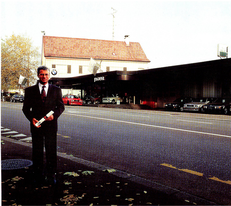
Die schicke Garage der Emil Frey AG in St. Gallen vertritt Jaguar und BMW

Die Garage an der Kolumbanstrasse 82 in St.Gallen ist ein Betrieb der Emil Frey AG, die mit ihren Importfirmen und dem Netz von eigenen Garagen in der ganzen Schweiz zu einem der führenden Unternehmen in der Automobilbranche gehört. Die Emil Frey AG St.Gallen ist seit langer Zeit auf die beiden Nobelmarken Jaguar und BMW spezialisiert und garantiert mit ihren Fachleuten einen exzellenten Dienst am Kunden. Dies bezieht sich nicht nur auf die seriöse Beratung beim Neuwagenkauf, sondern auch auf den Handel mit gepflegten Occasionen und auf die tadellosen Service- und Reparaturleistungen eines eingespielten Teams, das auf Wertarbeit eingeschworen ist.