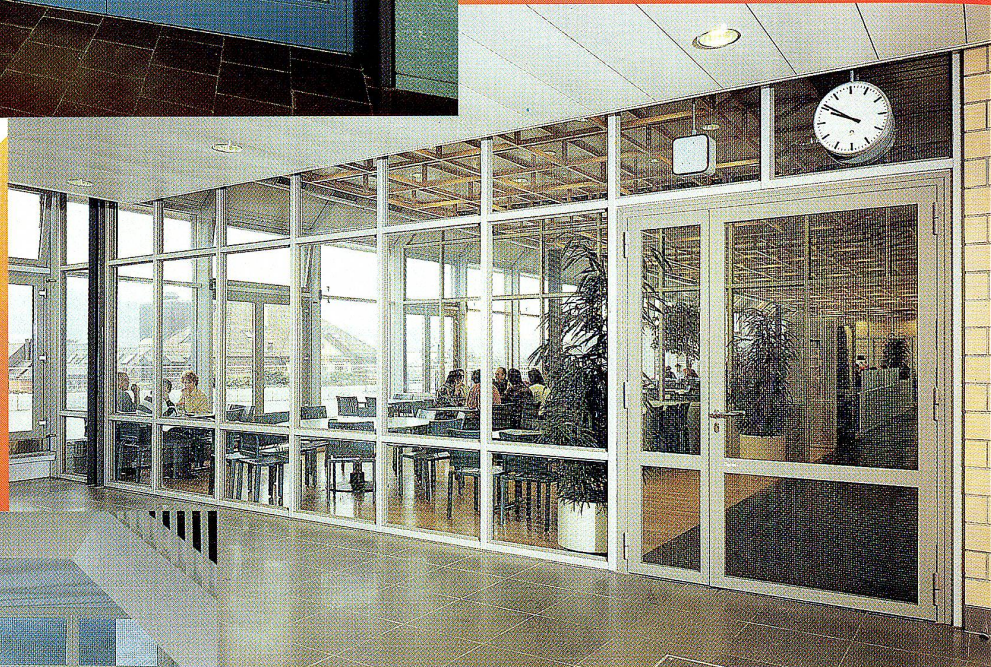
Brandschutzabschluss mit Eingangstür zum Personalrestaurant ▶

Brandschutztüren und -Abschlüsse in allen Etagen des neuen PTT- Gebäudes in Zürich.