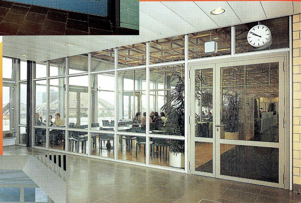
Brandschutzabschluss mit Eingangstür zum Personalrestaurant ▶

Brandschutztüren und -Abschlüsse in allen Etagen des neuen PTT- Gebäudes in Zürich.