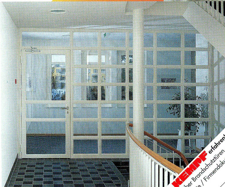
Brandschutzabschlüsse im Altersheim Dietikon ▲

Weitere Referenzen zeigen Ihnen unsere Kundenbe- rater gerne persönlich.