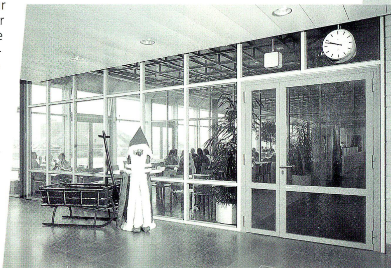
Transparenter Brandschutzabschluss mit integrierter Türe zum Personalrestaurant in der neuen Sihlpost in Zürich.

leistet bleiben. Die gleichen Anforderungen werden auch an die feuerfesten Glasfüllungen gestellt. Trotz allem technisch Nötigen lassen sich Brandschutzabschlüsse dank modernsten Materialien ästhetisch schön gestalten. Farbgebung, Aufteilung und Transparenz sind weitgehend wählbar. Auch der Schliessmechanismus zeigt sich sehr vielseitig. Mechanisch oder elektrisch, integriert ins bestehende Feuermeldesystem oder mit separatem Rauchfühler im Türschliesser, sind nur einige der bewährten Möglichkeiten. Kempf dokumentiert diese Vielseitigkeit bereits an zahlreichen Grossprojekten, welche mit Kempf-Brandschutzabschlüssen ausgerüstet worden sind. In der langen Referenzliste stehen zum Beispiel die neue Sihlpost in Zürich, das Altersheim in Dietikon und das Spital in Wetzikon. Eine kostenlose Beratung erhalten Interessenten in den Kempf-Geschäftsstellen in Muolen SG, Sulgen TG, Dietikon ZH, Toffen BE, Lausanne VD und Lostallo TI.