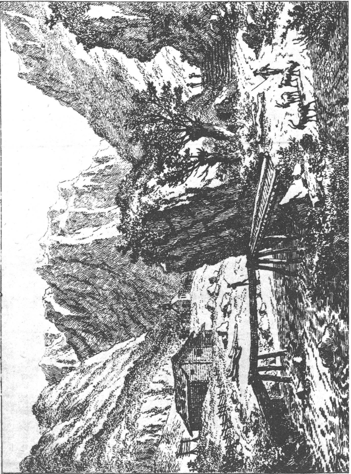
1. Rhein-Brücke, nahe bei St. Roch, im Meoßer Thal in Bünzen.