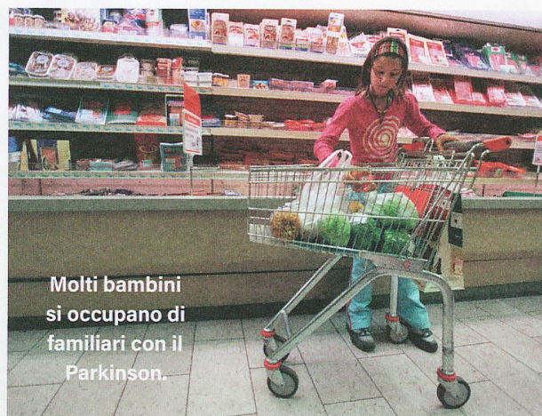
Molti bambini si occupano di familiari con il Parkinson.