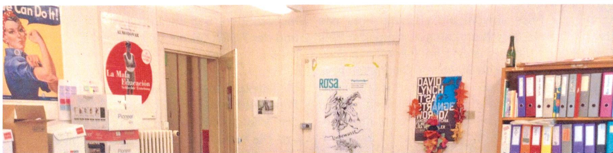
Jetzt noch farbig, bald leergeräumt wird sie nochmals selber ein Fundstück - die Uni-Redaktion.