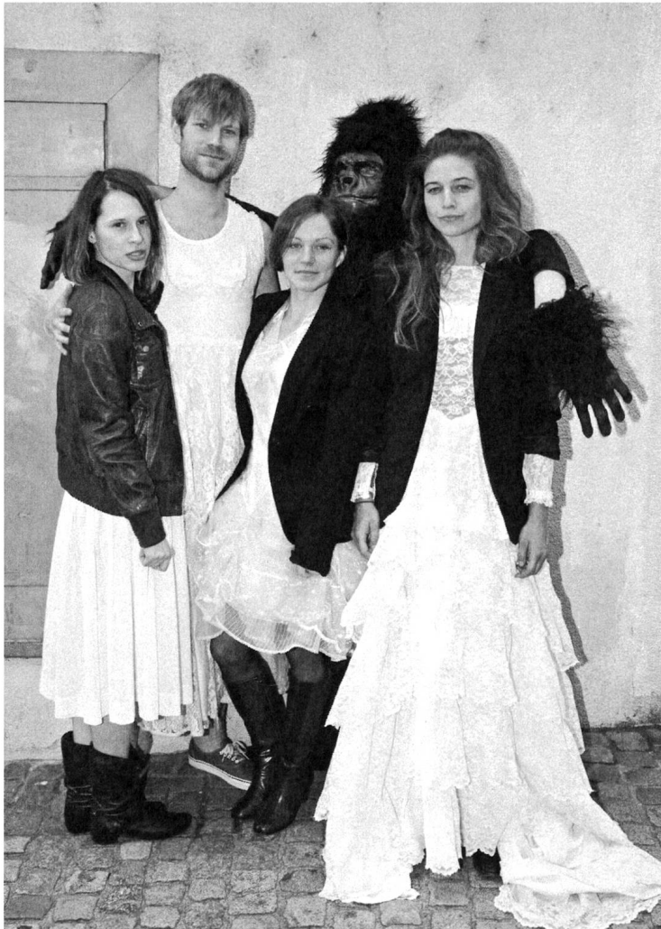
Das Ensemble von «Frauenbewegung ja, aber rhythmisch».

sische Rollenmimen auf der Bühne, die Schauspielerinnen und Schauspieler verkörpern mehrere Figuren und sind auch als Menschen sichtbar. Der Schutz einer Figürlichkeit im klassischen Sinne entfällt. Und schliesslich behandelt der Abend keine kleinen, privaten Geschichten, sondern ganz offensichtlich politische Themen, die alle betreffen, möglicherweise mit Texten aus der eigenen Feder. Ein Verstecken hinter (scheinbar) grossen Autoren und ihren (scheinbar) grossen Dramen, gewürzt mit einer guten Portion Geschrei und ein paar Tränen, gibt es nicht. Die Künstlerinnen werden angreifbar. Das Eis ist dünn.