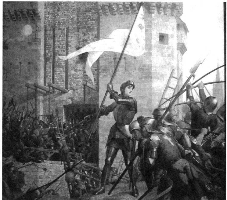
Beispiel einer unerhört unweiblichen Karriere: Jeanne d'Arc.