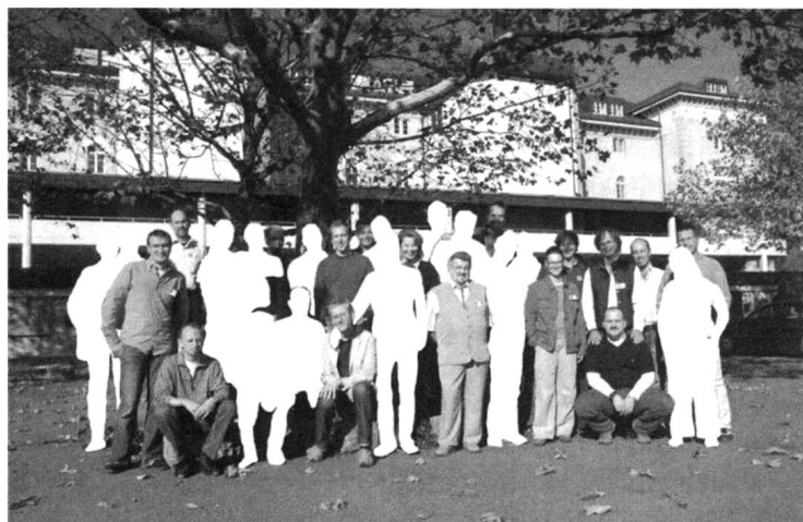
Die Partnerinnen und Partner, die mensch nicht zeigen darf.