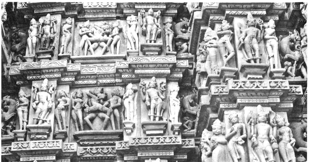
«Zu Anfang dachte man im englischen Königshaus darüber nach, die obszönen Bauten zu zerstören».