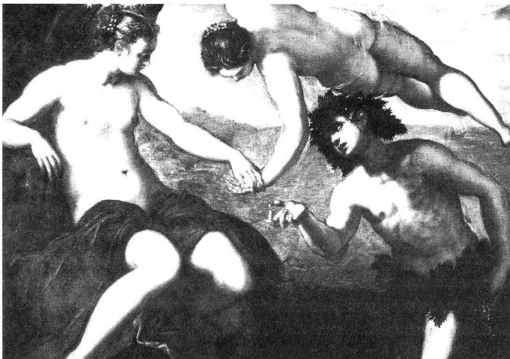
Venus und Bacchus mit Nietzsches idealer Frau - Ariadne.

Es wird also den Frauen aufgrund ihrer gesellschaftlichen (Ideal?-)Rolle eine spezielle Einsicht in die Wahrheit zugesprochen, indem beispiels-