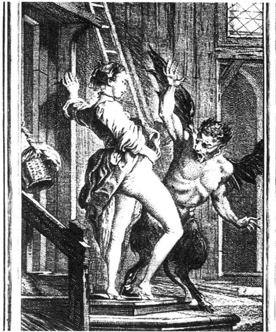
Der Dämon erschrickt ob der entblößten Scham.

Wie kann es sein, dass die von der Gesellschaft zu Schamhaftigkeit gezwungenen Frauen, die