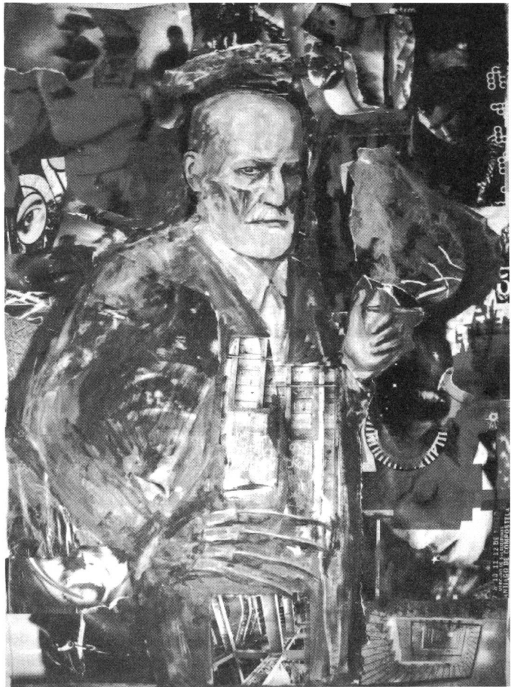
Freud-Collage von Alina Kopytsa (mehr auf Seiten 30 und 31)