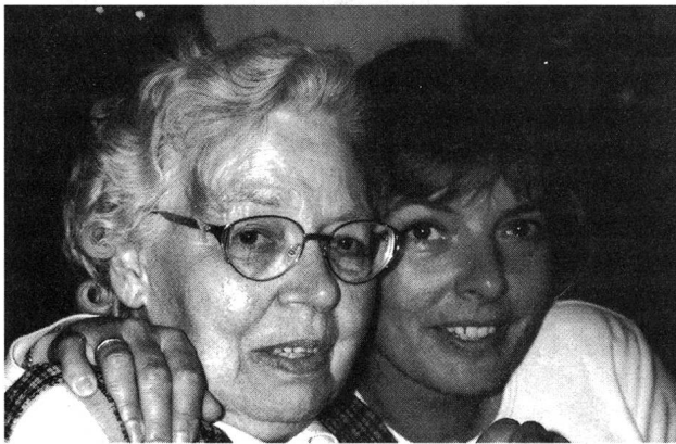
Blut von Mutter und Vater sind für uns gleich wichtig.

Über die bürgerlichen Familien sagt Foucault, dass sie eine «umgekehrte und dunkle Ahnentafel» führten, deren «beschämende Adelstitel» die Krankheiten oder Belastungen der Verwandtschaft waren: die progressive Paralyse des Grossvaters, die