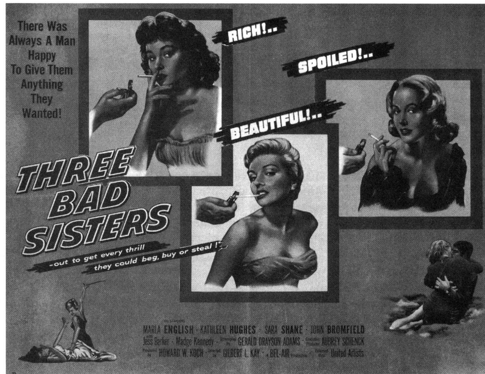
Fundstück: Three Bad Sisters (1956)