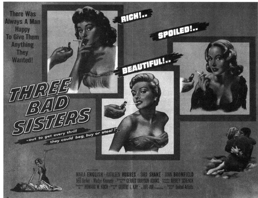
Fundstück: Three Bad Sisters (1956)