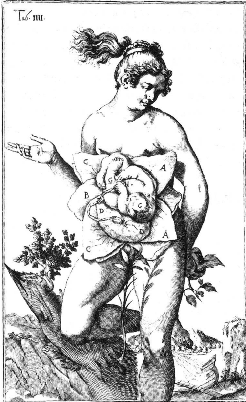
Befreien Reproduktionstechnologien das «Naturwesen Frau»?

programme beantwortet werden können. Auch Feministinnen sind sich nicht einig, obwohl es nicht an tiefgehenden feministischen Auseinandersetzungen mit Reproduktion im Allgemeinen