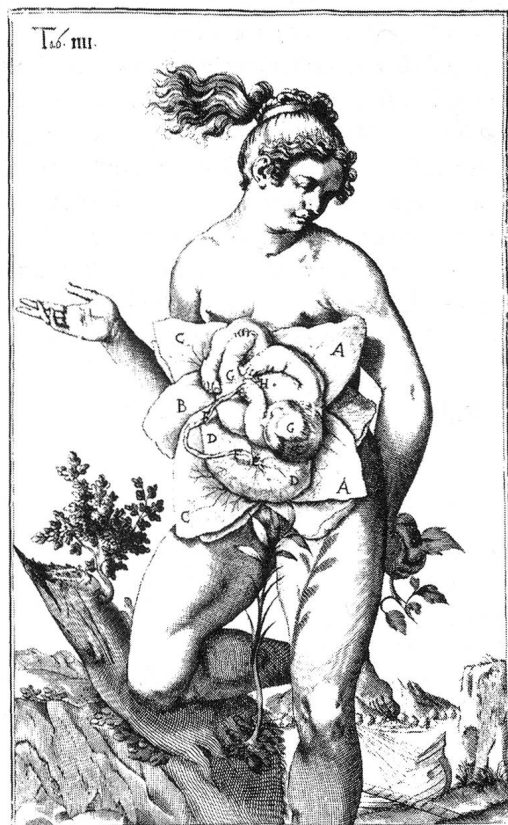
Befreien Reproduktionstechnologien das «Naturwesen Frau»?

programme beantwortet werden können. Auch Feministinnen sind sich nicht einig, obwohl es nicht an tiefgehenden feministischen Auseinandersetzungen mit Reproduktion im Allgemeinen