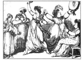
Ausgelassenheit ziemt sich nicht.

auszuschliessen. Sein Hauptargument war das Gefühl der Unschicklichkeit, das allein der Gedanke an eine ein Streich- oder Blasinstrument spielende Frau auslöst, und das von