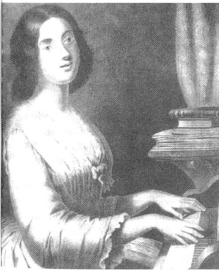
eine Grimasse beim Musizieren.