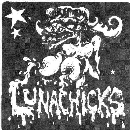
Die Punkrockerinnen von Lunachicks sind stets für feministische Provokation zu haben...

Musikagenturen wie Girlie Action war Teil der RG-Strategie. Doch auch wenn sich viele RG-Bands als feministische und antikapitalistische Kämpferinnen in der Kulturszene verstanden, drängt sich die Frage auf, was schlussendlich vom revolutionären Aufbruchs-Enthusiasmus übrig blieb. Um es vorweg zu nehmen: Die Bilanz ist relativ ernüchternd. So schreiben die Autorinnen von Lips, Tits, Hits, Power? zu Recht, dass der revolutionäre Gehalt der