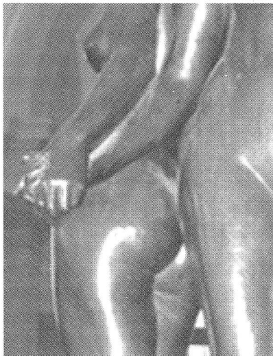
Der Zusammenhalt zwischen den Frauen ist bei männerdominierten Berufsfeldern sehr wichtig

Mit Sicherheit sind fehlende Informationen oder Vorurteile gegenüber den technischen Studiengängen ein grosses Problem. Schuld daran sind auch Unterschiede in der Sozialisation: Weil Jungen im Allgemeinen schon als Kind auf mathematischen