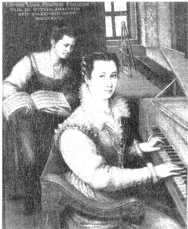
Lavinia Fontana, Selbst-Porträt am Spinett, 1577/8, Öl auf Leinwand, 27 x 24 cm, Accademia Nazionale di San Luca, Rom.

1552 wurde Lavinia Fontana in Bologna geboren. In Bologna befand sich eine der ersten Universitäten, an der Frauen überhaupt als Studentinnen zugelassen wurden. So herrschte dort sozusagen eine lange Tradition von gelehrten Frauen. Ihr Vater, Prospero Fontana, war selbst ein bekannter Maler und unterrichtete seine Tochter. Aus heutiger Perspektive scheint Lavinia sehr stark von Sofonisba Anguissola beeinflusst gewesen zu sein. Auch sie greift auf die Hinweise virgo und ex speculo und stellt sich somit in die Tradition der Jungfrau Marzia, die ihr Selbstbildnis aus einem Spiegel gemalt haben soll.