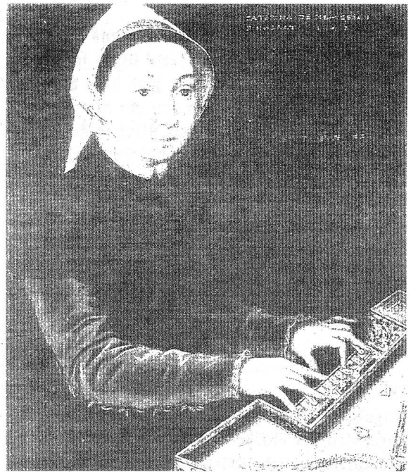
Caterina van Hemessen, Selbstporträt am Spinett, 1548, Öl auf Eichenholz, 32,2 x 25,7 cm, Wallraf-Richartz Museum, Köln.

betont sie äusserst genau, dass sie selbst die Urheberin des Gemäldes ist: Ego Caterina De Hemessen me pinxit 1546, aetatis suae 20 . 1 Das zweite Selbstbildnis entstand 1548 und zeigt Catherina am Spinett, mit ähnlicher Inschrift (Abb. 1).