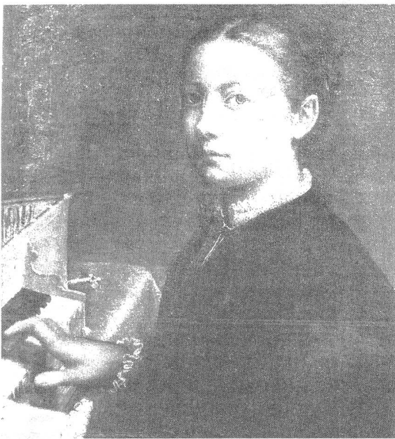
Sofonisba Anguissola, Selbst-Porträt am Spinett, um 1554, Öl auf Leinwand, 56,5 x 48 cm, Museo di Capodimonte, Neapel.

Bevor Sofonisba vollauf berühmt wurde, zeigte sie sich in zwei Bildsujets, die den vorgestellten Selbstporträts Caterina van Hemessens gleichen. 1554 entstand ein Selbstbildnis am Spinett (Abb. 2) und 1556 eines an einer Staffelei.