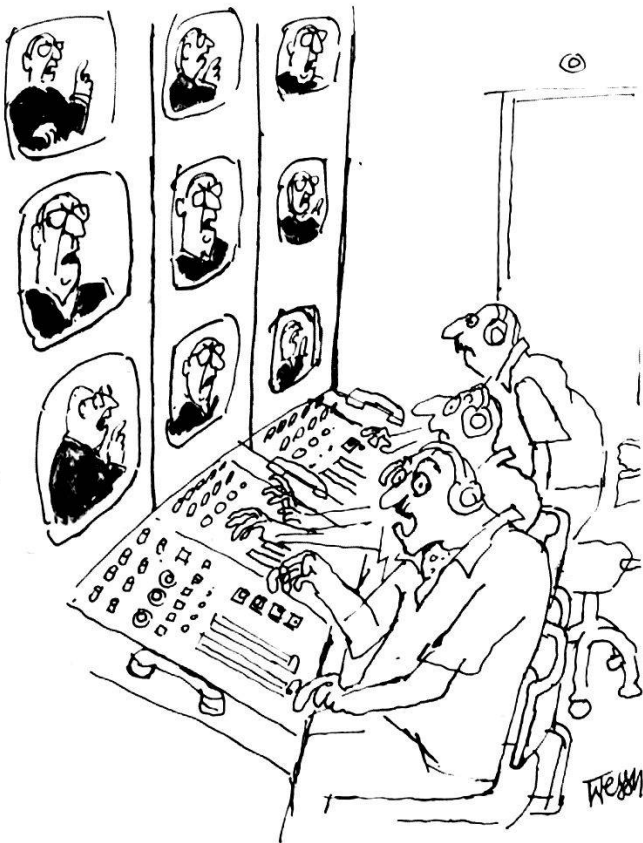
«Wer hat jetzt das Gelächter in die Rede des Nationalrates eingeblendet?»

Dies zum Beispiel steht in einer neuen, knapp hundertseitigen Broschüre der Berner Kantonalpartei mit dem Titel "wer wir sind - was wir wollen - was wir denken - wofür wir kämpfen". Die gut gestaltete Schrift umfasst übersichtlich dargestellt die Ziele der SP Bern und der SPS (Gestaltung: Marianne Walz und Edwin Knuchel). Sie kann für 4 Franken beim Berner Sekretariat (Postfach 2183, 3001 Bern) bezogen werden.