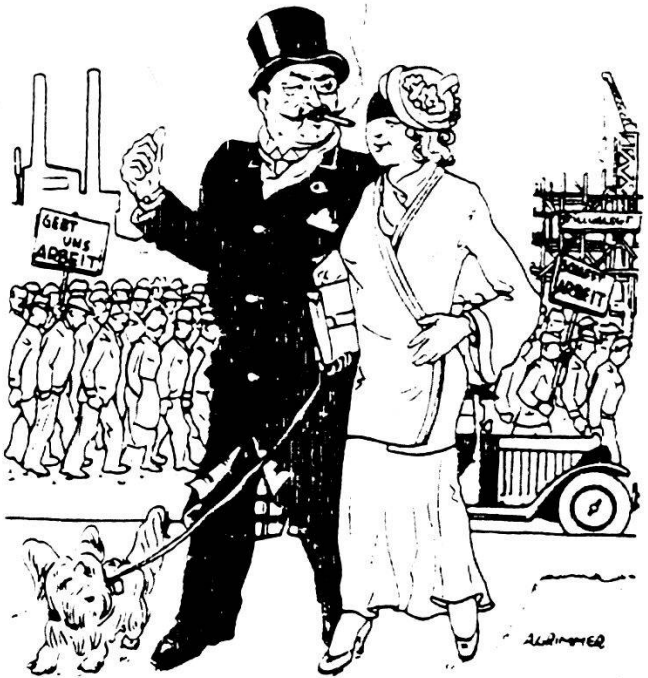
1932. „Lächerlich der Schrei nach Arbeit! Wir haben doch auch keine Arbeit und leben ganz gut!“