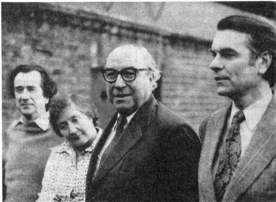
Die neuen «Sozialdemokraten» (von links nach rechts): William Rodgers, Shirley Williams, Roy Jenkins, David Owen

Die grosse Masse der bisherigen Parteimitglieder will damit nichts zu tun haben, aber die Gegenkräfte waren schon in der Vergangenheit nicht fest organisiert und sind es jetzt nach dem Auszug der Gründer der Sozialdemokratischen Partei schon gar nicht. Denis Healey, Michael Foots Stellvertreter, steht den Beschlüssen der Konferenz vom Januar 1981 ebenso kritisch gegenüber wie die Verfechter der Sozialdemokratischen Partei. Aber er verdammt jene, die der Partei gerade jetzt den Rücken zugekehrt haben, da der Kampf um ihre Erhaltung als demokratisch-sozialistische Kraft ausgefochten werden muss. So wie er denken ungezählte andere Parteifunktionäre, die in der Sache selbst der Kritik jener zustimmen, die mit der Partei gebrochen haben. Shirley Williams, Mitglied der provisorischen Führung der Sozialdemokratischen Partei, hingegen glaubt, dass die Partei, «die wir geliebt haben», wie sie sich ausdrückt, nicht mehr existiere. Der Parteiaustritt dieser Frau mit ihrer magnetischen Anziehungskraft auf die breiten Massen – einer Anziehungskraft, über die kein anderer Funktionär der