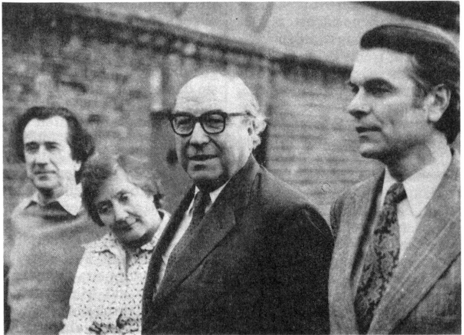
Die neuen «Sozialdemokraten» (von links nach rechts): William Rodgers, Shirley Williams, Roy Jenkins, David Owen

Die grosse Masse der bisherigen Parteimitglieder will damit nichts zu tun haben, aber die Gegenkräfte waren schon in der Vergangenheit nicht fest organisiert und sind es jetzt nach dem Auszug der Gründer der Sozialdemokratischen Partei schon gar nicht. Denis Healey, Michael Foots Stellvertreter, steht den Beschlüssen der Konferenz vom Januar 1981 ebenso kritisch gegenüber wie die Verfechter der Sozialdemokratischen Partei. Aber er verdammt jene, die der Partei gerade jetzt den Rücken zugekehrt haben, da der Kampf um ihre Erhaltung als demokratisch-sozialistische Kraft ausgefochten werden muss. So wie er denken ungezählte andere Parteifunktionäre, die in der Sache selbst der Kritik jener zustimmen, die mit der Partei gebrochen haben. Shirley Williams, Mitglied der provisorischen Führung der Sozialdemokratischen Partei, hingegen glaubt, dass die Partei, «die wir geliebt haben», wie sie sich ausdrückt, nicht mehr existiere. Der Parteiaustritt dieser Frau mit ihrer magnetischen Anziehungskraft auf die breiten Massen – einer Anziehungskraft, über die kein anderer Funktionär der