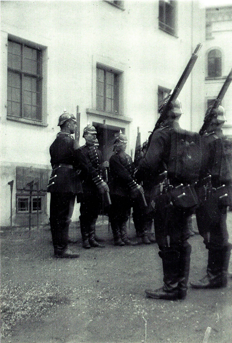
Kaiserliche Soldaten des Badischen Infanterie- Regimentes Nr. 114 im Hof der Konstanzer Klosterkaserne

Konstanzer Vorstands versuchten den Verein auch zu einem gesellig-kulturellen Treffpunkt für Frauen zu machen. Aus diesem Grund veranstalteten sie 1911 im Hotel Terminus einen ersten Unterhaltungsabend, bei dem fast ausschließlich Frauen mit Wort-, Musik- und Gesangsdarbietungen das Programm bestritten. Der Frauenstimmrechtsverein war in einer Zeit entstanden, in der sich das Wahlrecht generell verändert hat. (Direkte Wahl zum Landtag 1905, Verhältniswahlrecht in den Kommunen 1912.) 5