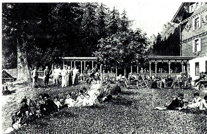
Feriengäste auf der Liegewiese vor dem Alpenkurhaus Gaflei. Postkarte um 1900