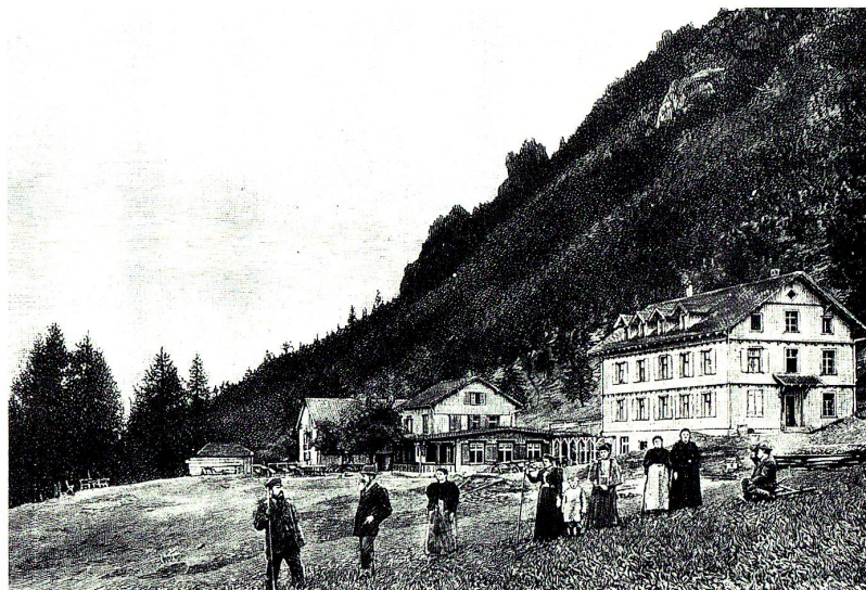
Alpenkurhaus Gaflei. Xylographie um 1898