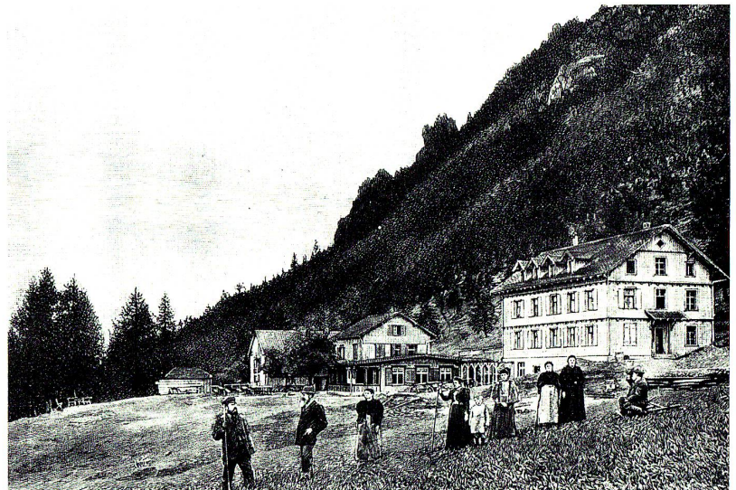
Alpenkurhaus Gaflei. Xylographie um 1898