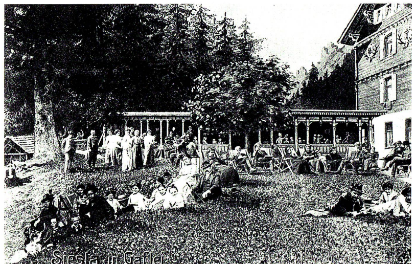
Feriengäste auf der Liegewiese vor dem Alpenkurhaus Gaflei. Postkarte um 1900