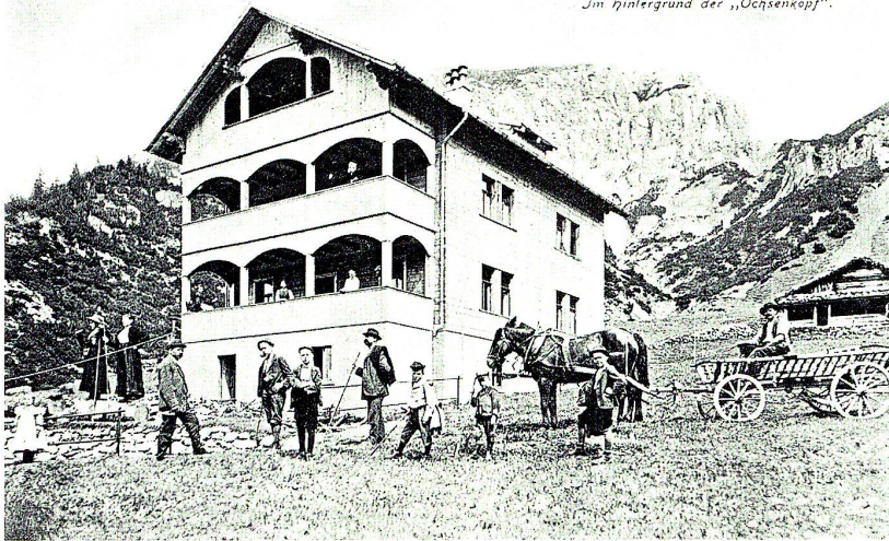
Alpenkurhaus und Touristenstation Malbun, 1650 Meter ü. M., eröffnet 1908. Ansichtskarte um 1910

kerung und nicht selten der vorzügliche Wein geschildert und besungen.