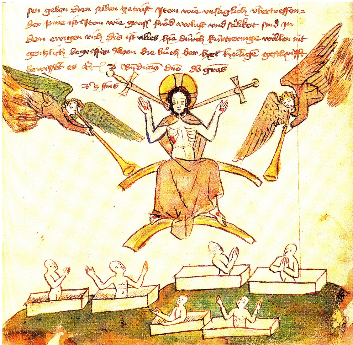
Das Jüngste Gericht. Stiftsarchiv Pfäfers im Stiftsarchiv St.Gallen, fol. 120r.

ista porcorum, hominum scilicet bestialiter et turpiter viventium. Qui tamen duo milia figuraliter esse dici possunt: duo, quia divisi sunt a bono; milia quia perfecti sunt in malo.» 2000, eine Verdoppelung, weist im 7. Buch der Könige auch auf die Völker der Juden und Christen hin, die durch die Wiedergeburt der Taufe zum ewigen Leben berufen sind, eine patristische Deutung.