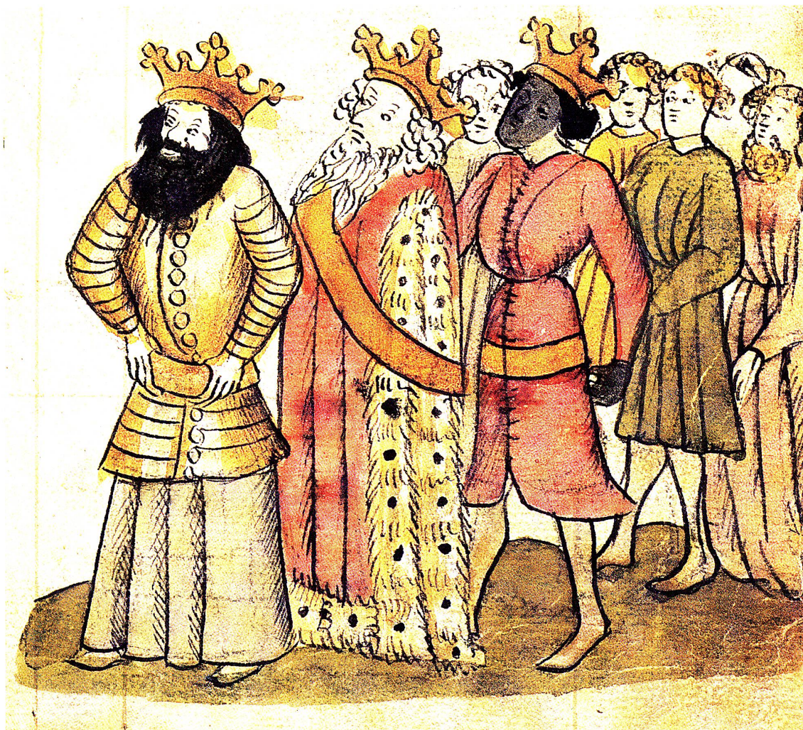
Die Könige von Ägypten, Libyen und aus dem Mohrenland (Äthiopien) ziehen zum Antichrist. Mitte 15. Jahrhundert. Illustration zum Deutschen, «Antichrist – Bildertext». Stiftsarchiv Pfäfers im Stiftsarchiv St.Gallen, Cod. Fab. XVI, fol. 113r.

Aus der Bibelexegese war die Zahl 1000 die «pars pro toto», also stand sie für eine grosse Menge. Es gibt deshalb sehr viele Bibelstellen, gerade im Alten Testament, in den Psalmen, in denen die Zahl 1000 genannt ist. Sie bedeutet eine grosse Menge, etwa 1000 Stiere, 1000 Generationen, 1000 Ellen. Die Bedeutung dieser Zahl kann verschieden interpretiert werden, etwa als Zahl der Vollkommenheit. Es ist sogar möglich, dass wie im Hohen Lied die Zahl 1000 auf die Gesamtheit der Menschen verweist, oft auch auf die Gesamtheit der Heiligen. In der Ezechiel-Vision werden etwa 1000 Ellen des von der Tempelschwelle wegfließenden Wassers gemessen, wobei Christus präfiguriert wird mit einer Fülle von Gnaden, die er in diesem Umfang schenkt. Natürlich ist die Apokalypse nicht zu vergessen, die auf Lateinisch vom «regnum mille annorum», vom Tausendjährigen Reich, von der tausendjährigen Herrschaft spricht. Ein himmlischer Engel fesselt den Teufel und setzt ihn für tausend Jahre gefangen. Nun setzt eine tausendjährige Herrschaft Christi ein. Oft sind diese tausend Jahre wörtlich genommen und damit missverstanden worden. Im Sinne der mittelalterlichen Zahlensymbolik ist eher die Annahme damit verbunden, dass es sich um einen Ausdruck für die Gesamtheit und Vollkommenheit des Reiches Christi handelt.