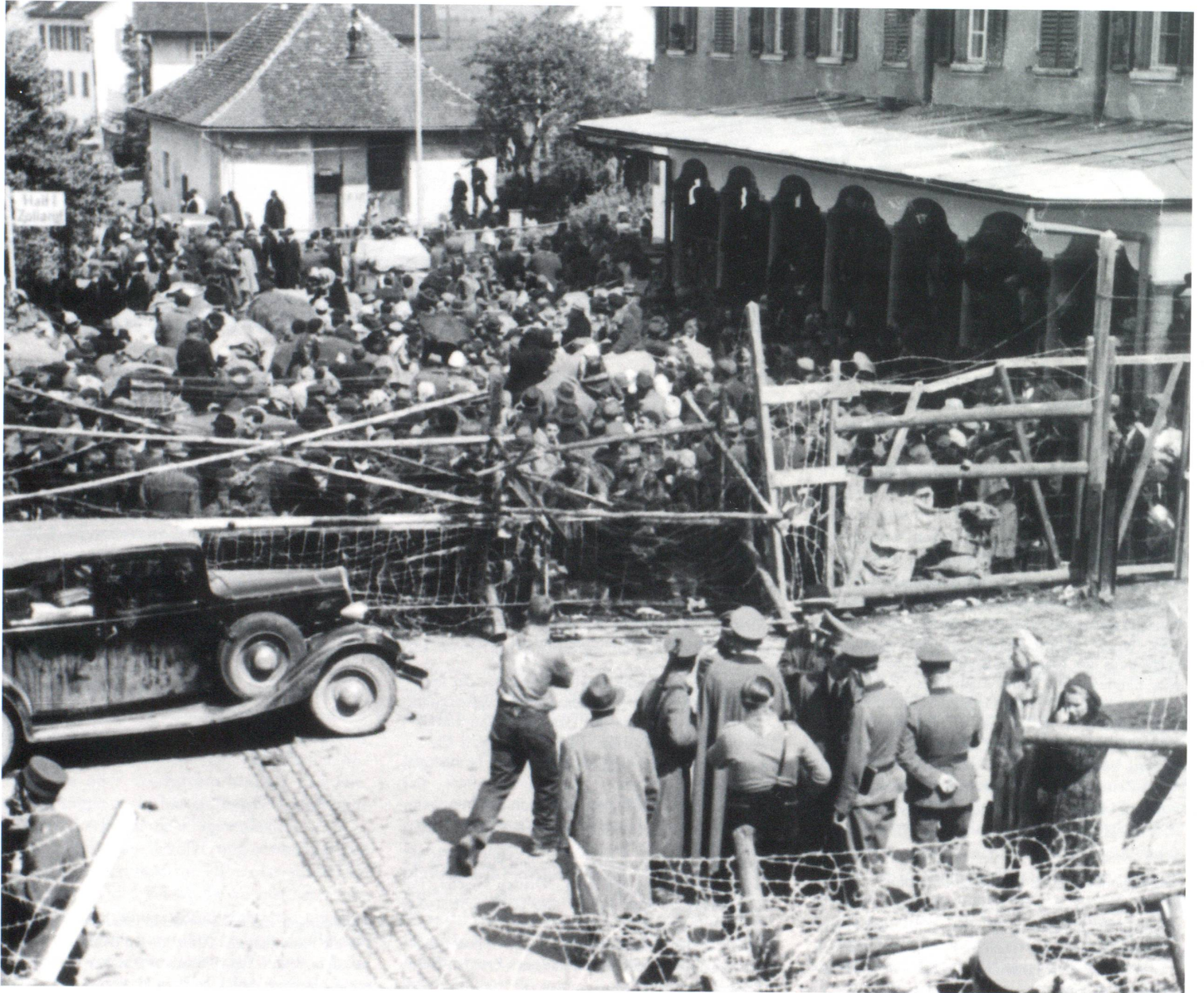
In den letzten Kriegstagen 1945: An der liechtensteinischen Grenze in Schaanwald herrscht chaotischer Andrang von Übertrittswilligen aus dem grossdeutschen Reichsgebiet.