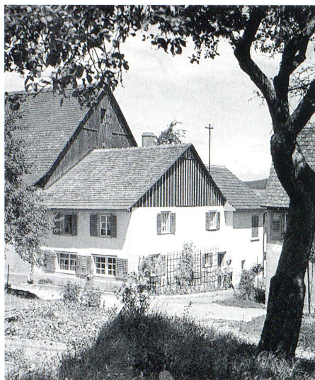
Wohnhaus Dittrich um 1939.

Für den Augenblick hat auch unsere Kartoffelnot ein Ende. Habe selbst einige grosse neue geerntet, dazu gab es heute eigene Erbsen und gelbe Rüben ... Der Weinberg ist fein in Ordnung, sauber gehackt und aufgebunden. Das mache ich ja nun alles selbst, und es hat viel Trauben wie noch