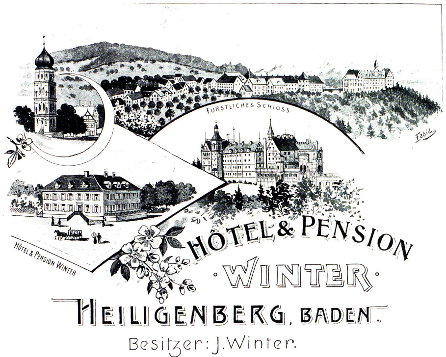
Werbe Prospekt für das Hotel «Winter» in Heiligenberg, ca. 1890.

Schloss Heiligenberg, Holzstich nach G. Wolf, spätes 19. Jahrhundert.