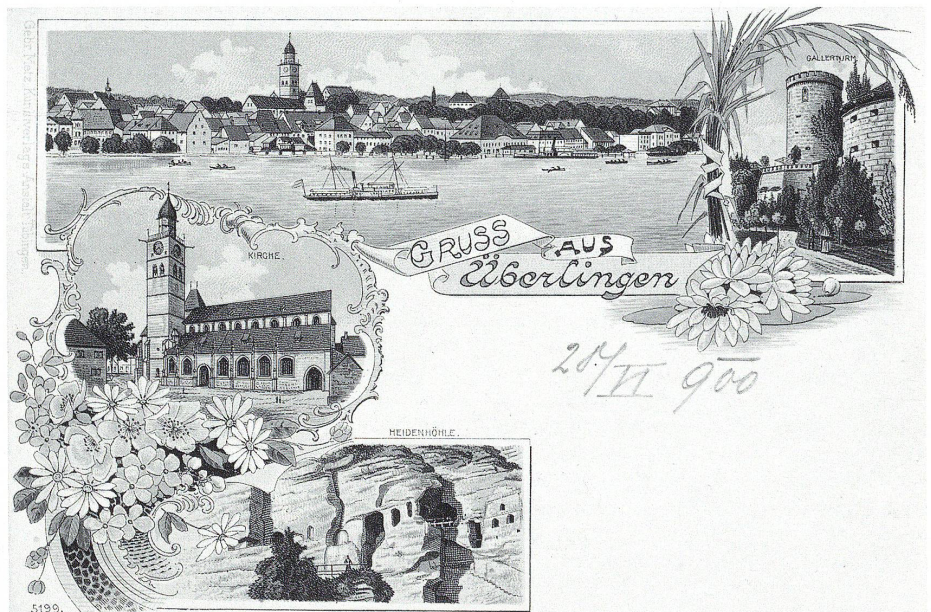
Ansichtskartengruss aus Ueberlingen, Lithographie. Kreisarchiv Bodenseekreis.

J. N. MÜLLER: Die Mineralquell- und Seebade-Anstalten in Ueberlingen a. B. mit ihren Umgebungen. Villingen 1860. S. 23-25, S. 27-31, S. 107 f.