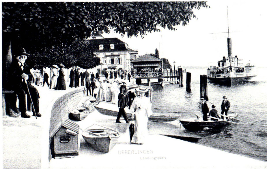
Ansichtskarte um 1900.

J. C. HEER: Freiluft. Konstanz o. J. (ca. 1905), S. 134–136.