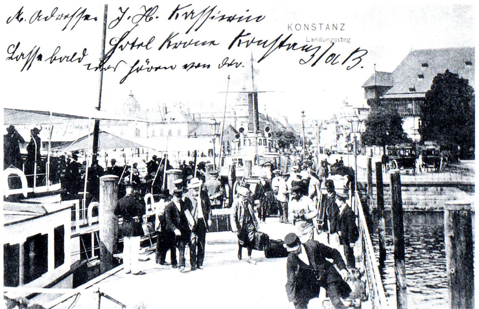
Regel Ausflugs- und Reiseverkehr am Hafen Konstanz um 1900.