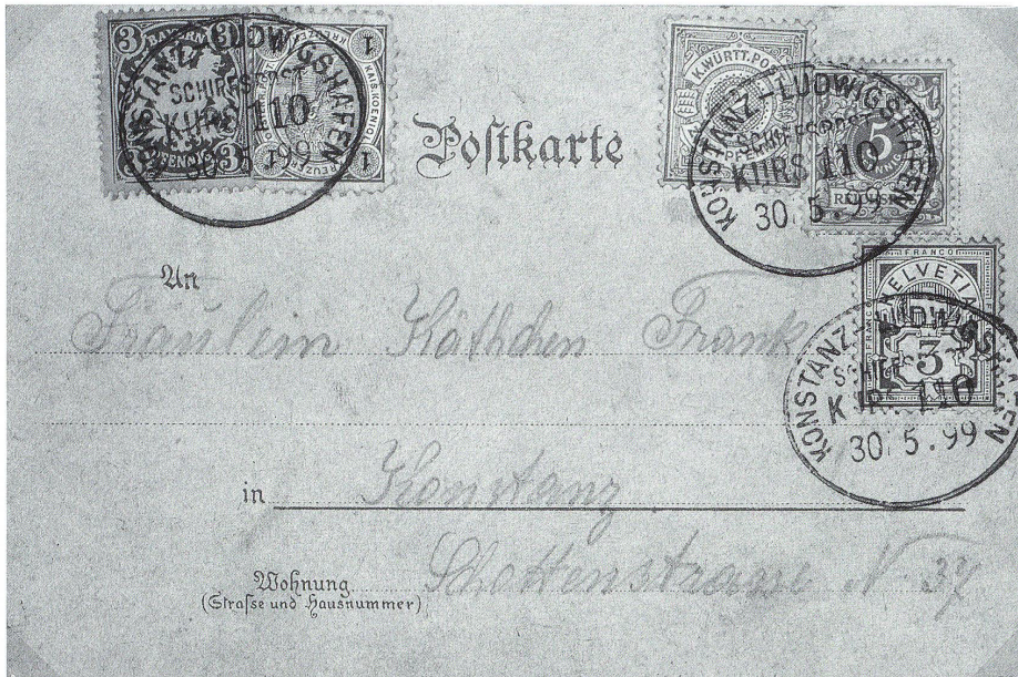
Eine philatelistische Rarität: Die «Fünf – Länderfrankatur» – ein Stempel der badischen Schiffspost, datiert vom 30. 5. 1899, zielt Briefmarken aus den fünf Bodenseeufer-Anrainerländern.

Nach dem Verlassen des Hafens von Meersburg geht es vorbei am Weinort Hagnau und an Immenstaad nach Friedrichshafen. Danach taucht schliesslich am Ufer eine grosse Halle auf. Unruhe ergreift die Passagiere. Würde man das Luftschiff Zeppelin zu sehen bekommen? Wahrhaftig! Es schwebt wie eine riesige Zigarre, durch dicke Taugel gehalten, knapp über der Wasseroberfläche vor der Manzeller Halle. Durch die Last der Neugierigen, die sich dieses Spektakel nicht entgehen lassen, neigt sich die «Habsburg» zum Ufer hin, als wolle sie dem Luftschiff Respekt zollen. Doch