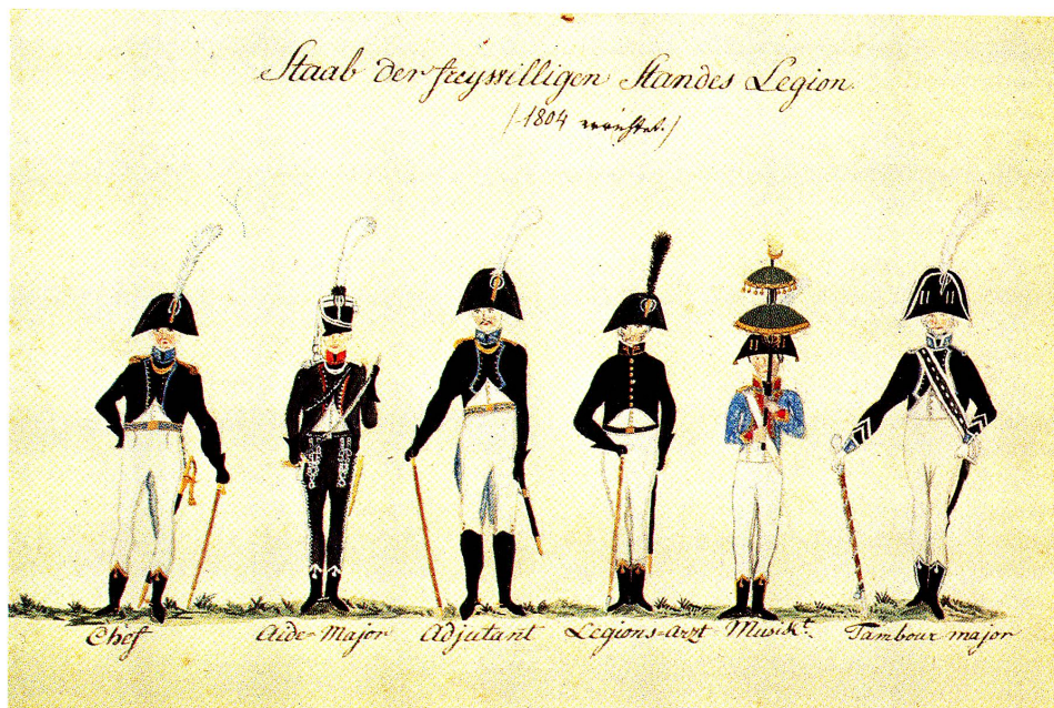
Freiwillige Legion des Kantons St.Gallen um 1804/05.

Die Militärorganisation von 1804 regelte die Uniform der Stabsoffiziere: «Die Staabs-Offiziere, welche an kein besonderes Corps attachiert sind, tragen goldene Epauletten nach ihrem Grade, gelbe Knöpfe, weisses Gilet und Beinkleider, samt einem weissen und grünen Panasche.» Die Ikonographie zeigt, dass der Zweispitz mit einem ganz weissen Federstutz, der Kantonskardie unter der goldenen Gans und goldenen Fransen an den Hutspitzen versehen war. Der dunkelblaue zweireihige lange Rock mit breiten Rabatten hatte Kragen, Ärmelumschläge, Futter und Passepoil der Rabatten und Retroussis in Hellblau. Dazu kamen ein kurzes weisses einreihiges Gilet und lange enge weisse Hosen. Die kurzen schwarzen herzförmig ausgeschnittenen Husarenstiefel waren sicher bei den höhern Stabsoffizieren golden bordiert und mit einem goldenen Zöttelchen versehen. Schwarze Stulpenhandschuhe verdeckten wohl spitze hellblaue Ärmelumschläge mit zwei Knöpfen. Alle