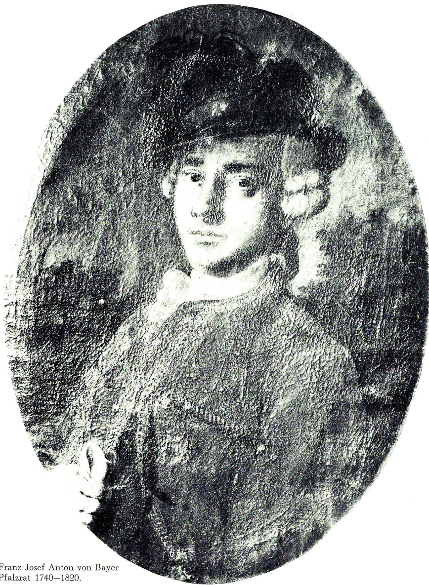
Franz Josef Anton von Bayer Pfalzrat 1740–1820.

der die Prunkbauten aus der 2. Hälfte des 18. Jahrhunderts noch heute Zeugnis abgeben.