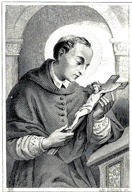
Weitverbreitetes volkstümliches Andachtsbild aus dem letzten Jahrhundert.

Warum kam neben dem hl. Nepomuk gerade Karl Borromäus als Türhüter für Marienberg in Frage? Bei ihm ist eine direkte Beziehung da zu Marienberg. Anlässlich einer Visitationsreise durch die Schweiz übernachtete er vom 27. auf den 28. August 1570 im Kloster Marienberg. Wir werden noch darauf zurückkommen.