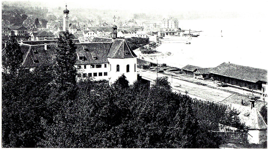
Oben: St.Scholastika von Osten.

Auf der Bodenfläche des ehemaligen Klosters St.Scholastika, vor dem Haus Scholastikastraße 15, steht ein kleiner Bildstock. Die Heilige des einstigen Klosters ist mit erhobenen Händen dargestellt, darunter die Bitte: Sancta Scholastika, ora pro nobis! Dieser Bildstock soll genau am Ort errichtet