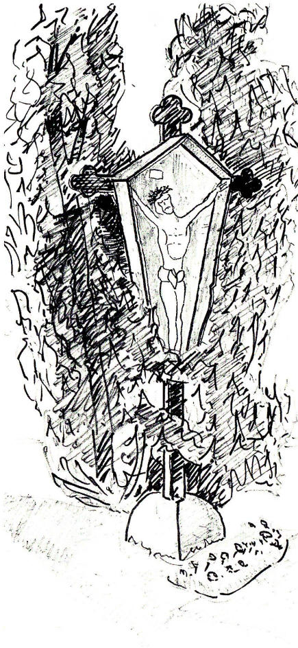
Links: Wegkreuz, Zelgstraße (15), Zeichnung vom Verfasser.