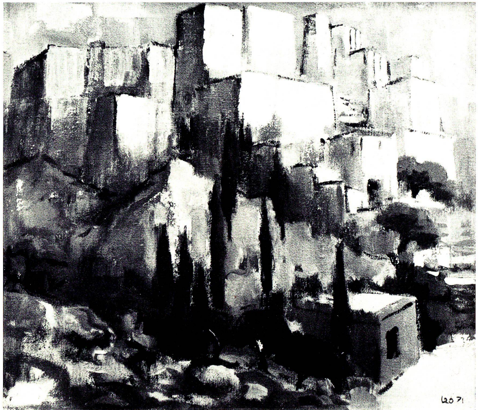
Akropolis von Athen, vom Areopag aus gesehen, Öl.

Es muß für einen empfindsamen Menschen eine schwere Bürde sein, gleichzeitig zwei Rucksäcke durchs Leben zu tragen. Der eine, in dem Kästli den für den Lebensunterhalt notwendigen Proviant mitführte, mag ihm oft zu schwer gewesen sein. Aber auch der andere, in dem er Farbe und Pinsel manchmal fast etwas scheu und zurückhaltend durchs Leben trug, kam ihm sicherlich nicht