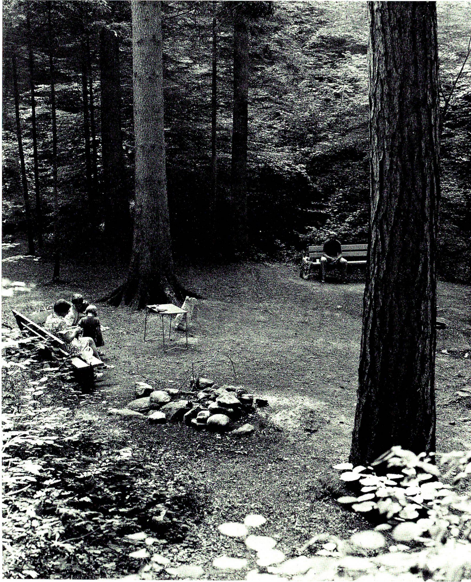
Ein Rastplatz im Goldacher Erholungsgebiet Withen.