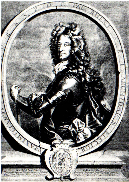
Kurfürst Maximilian II. Emmanuel von Bayern (1662–1726).

gen vermeiden ließ, um von Fall zu Fall die Stellung Bayerns im Reich neu zu bestimmen und die dynastischen Möglichkeiten der Wittelsbacher im europäischen Mächtekonzern wahrzunehmen. Die Herzoge von Bayern der späteren Zeit konnten das Bild Groß-Bayerns, wie es unter den fränkischen Königen sich von der Regnitz im Norden bis zur Adria im Süden, vom Lech im Westen bis zur Leitha im Osten erstreckte, nie vergessen. Die Ottonen hatten die Ostmark, das spätere Österreich, vom übergroßen Herzogtum abgetrennt, deren Machthaber, die Babenberger und die nachfolgenden Habsburger, erschienen den eingeeengten bayrischen Herzogen als nicht voll zu Recht begünstigte Rivalen, mit denen zwar als Nachbarn ein schieflich-friedliches Verhältnis zumeist angezeigt erschien; aber ein Kon-Dominium nach der Art Ludwig des Bayern und Leopolds von Österreich, das nutzloses Blutvergießen beendete und den Anspruch auf die deutsche Königskrone dem stärkeren Ludwig vorbehielt, blieb ein Leitbild künftiger bayrischer Politiker 81 . Der bayrische Hof war denn auch durch Jahrhunderte auf die Bewahrung der Eigenständigkeit und eines möglichst weiten Spielraumes der politischen Handlungsfreiheit bedacht. Deshalb unterhielt er auch stets gute Beziehungen mit dem national geeinten französischen Königtum,