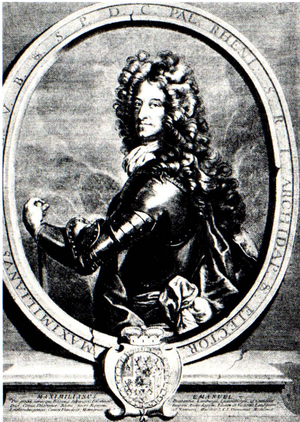
Kurfürst Maximilian II. Emmanuel von Bayern (1662–1726).

gen vermeiden ließ, um von Fall zu Fall die Stellung Bayerns im Reich neu zu bestimmen und die dynastischen Möglichkeiten der Wittelsbacher im europäischen Mächtekonzern wahrzunehmen. Die Herzoge von Bayern der späteren Zeit konnten das Bild Groß-Bayerns, wie es unter den fränkischen Königen sich von der Regnitz im Norden bis zur Adria im Süden, vom Lech im Westen bis zur Leitha im Osten erstreckte, nie vergessen. Die Ottonen hatten die Ostmark, das spätere Österreich, vom übergroßen Herzogtum abgetrennt, deren Machthaber, die Babenberger und die nachfolgenden Habsburger, erschienen den eingeengten bayrischen Herzogen als nicht voll zu Recht begünstigte Rivalen, mit denen zwar als Nachbarn ein schieflich-friedliches Verhältnis zumeist angezeigt erschien; aber ein Kon-Dominium nach der Art Ludwig des Bayern und Leopolds von Österreich, das nutzloses Blutvergießen beendete und den Anspruch auf die deutsche Königskrone dem stärkeren Ludwig vorbehielt, blieb ein Leitbild künftiger bayrischer Politiker 81 . Der bayrische Hof war denn auch durch Jahrhunderte auf die Bewahrung der Eigenständigkeit und eines möglichst weiten Spielraumes der politischen Handlungsfreiheit bedacht. Deshalb unterhielt er auch stets gute Beziehungen mit dem national geeinten französischen Königtum,