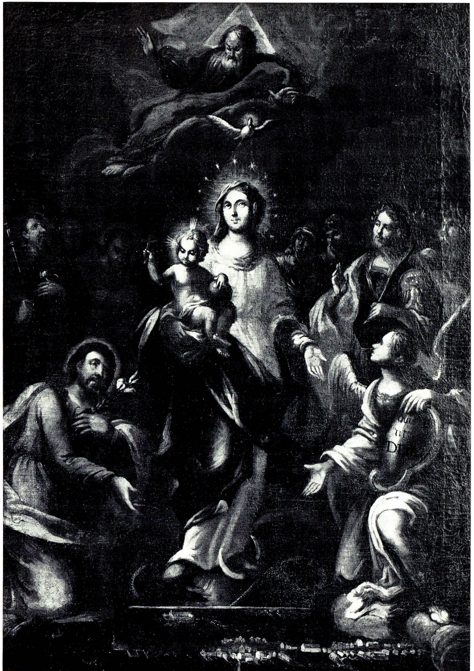
Oben: Madonna mit Jesuskind im Kreis der in Rorschach besonders verehrten Heiligen von J. G. Ulmer

In der linken Gruppe (vom Bilde aus) fesselt uns vorab die Figur des hl. Erzengels Michael. Das Gesicht in Ehrfurcht der Madonna zugewandt, bekundet er mit der einen Hand die Hingabe an die Gebenedeite und weist mit der andern auf die biblischen Worte des Schildes: Quis ut Deus? (Wer ist wie Gott?) Die ganze Gestalt offenbart eine graziöse Bewegtheit und eine vornehme Kraft, die sie vor allem in der Fußpartie zum Ausdruck bringt. Mit besonderem Nachdruck wendet sich der Maler der Darstellung des hl. Konstantius zu. Er gibt dem römischen Märtyrer, dessen Leib als kostbare Gabe im Jahre 1671 der Pfarrei geschenkt worden war, die Palme des Martyriums in die Hand und krönt ihn mit dem Lorbeerkranz der ewigen Glorie. Das grün-blaue Prachtgewand, das ein roter Mantel deckt, wird oben durch eine goldene Spange zusammengehalten. Zwischen ihm und der Madonna glauben wir im Hintergrund Sankt Joachim und Anna, die Eltern Mariens, zu erkennen. Für die Ermittlung der letzten Gestalt der linken Gruppe (vom Bild aus gesehen) fehlen uns Anhaltspunkte. Es handelt sich jedoch um eine männliche Figur. Man mag an einen von jenen Heiligen denken, die bei der feierlichen Translation des hl. Konstantius zur Darstellung gelangt waren (1674). Sollen wir etwa St. Bernhard nennen oder St. Antonius, den Einsiedler? Ein Wappen, das rechts außen zu unterst in